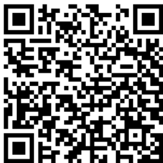
中度融合組報名表