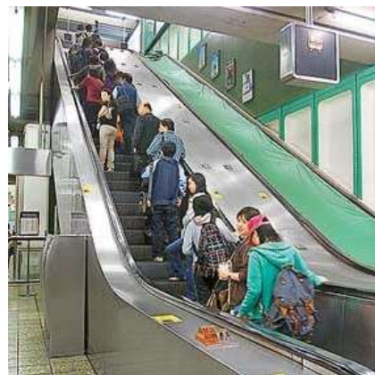
適當使用社區設施