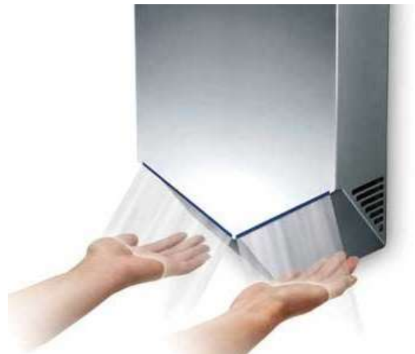
用乾手機代替抹手紙