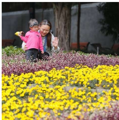
不破壞公園中的 花草樹木