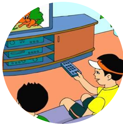
小心使用 家中物品