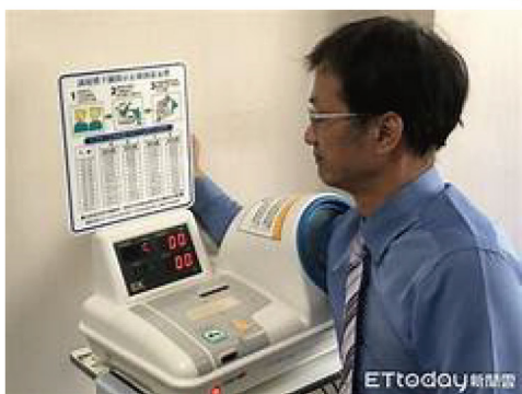
醫院自助量血壓機