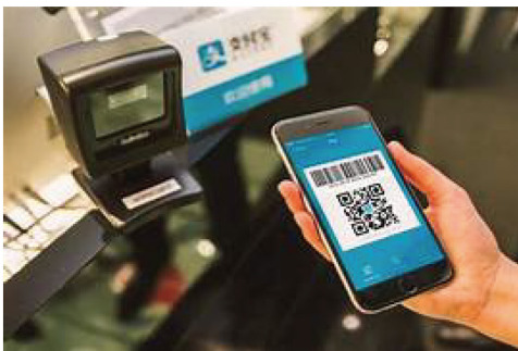
手機電子付款系統