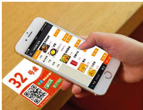
QR code 點餐系統