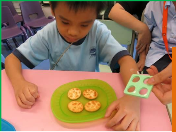
下午茶時間，文飛要 4 塊餅乾。