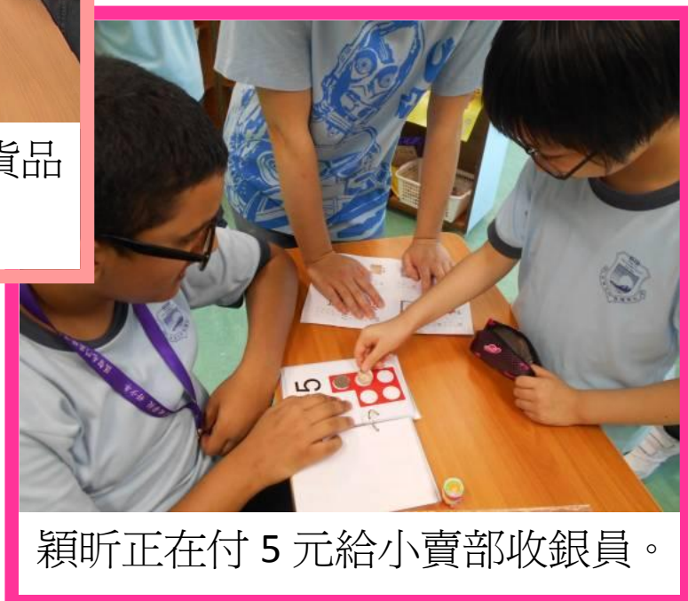
穎昕正在付 5 元給小賣部收銀員。