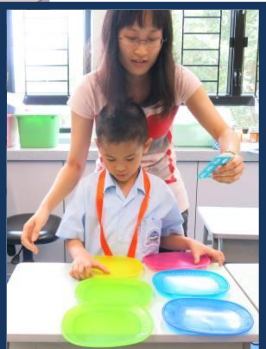
灝鏡看看老師手上的牌，取出 6 個碟放在檯上。