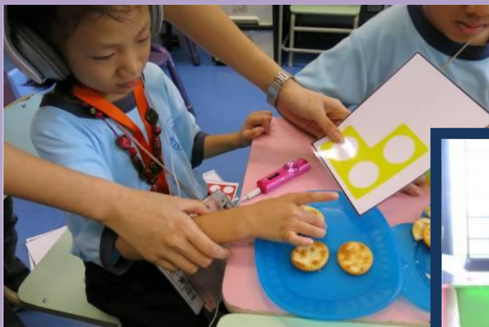
紫彤要 3 塊餅乾。