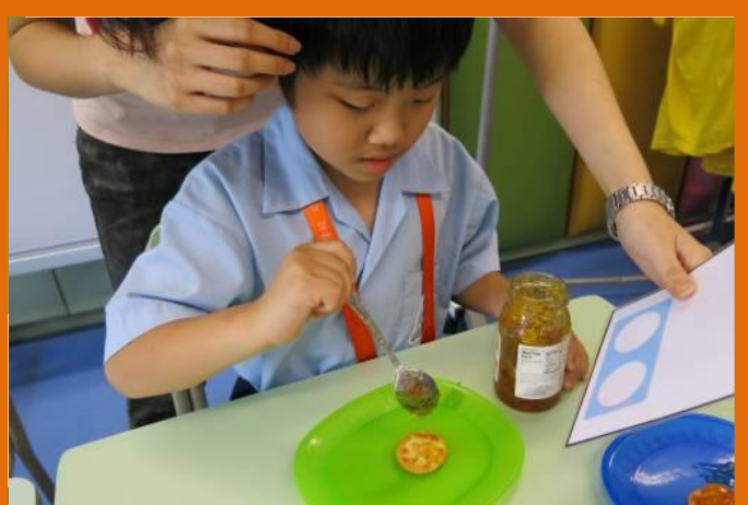
彥忠要在餅乾上塗 2 羹果醬。