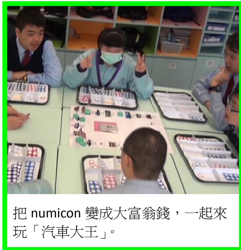
把 numicon 變成大富翁錢，一起來玩「汽車大王」。