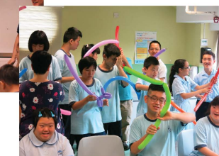
今年仍然有周會，但加多一天「奇趣周會」。看同學學得多開心。