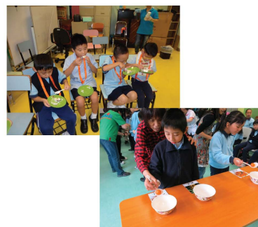
為了讓同學有更寬敞的地方玩遊戲，活動組把生日會分在兩個不同場所舉行，玩得更開心，吃得更舒暢。