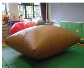
這是感統室的新成員一大汽墊，它讓同學爬上爬落，既可練習腳又好玩。鬆晒！