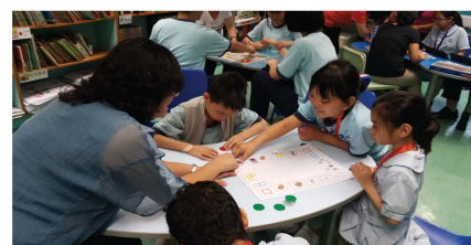
去年舉辦過家長遊戲工作坊，今年便開設了棋類小組，由家長指導學生玩。