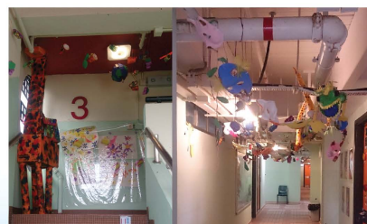
三樓的走廊，變了藝術廊，展示學生的成品。

學校變了很多，環境變了，學習機會多了，體驗亦豐富了，這都要歸功於全體教職員的努力。之後屯曦會變成怎樣？有家長的支持和參與，相信明天的學校會更好，我們一起努力！