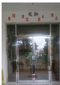
未入學校大堂，已見到換成通透玻璃的鋼門，既美觀又安全。

時間過得很快，不經不覺，擔任校長的工作已經一年。如何讓學校變得更好，學生學得更豐富，是作為校長首要思考的事。2014-2015是我的第一年，舊中有新，新中有舊。我誠意邀請家長陪我一起走過這一年的足跡。