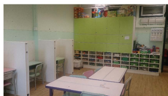
自閉症資源室，改頭換面，上課好舒服啊！